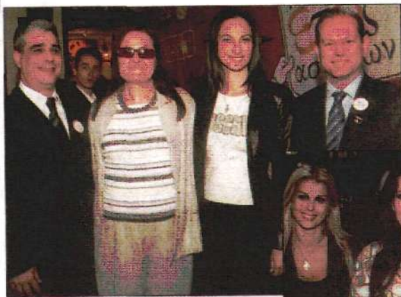
Η βουλευτής Επικρατείας ΕΡ. Μπερτιδάκη, η βουλευτής Έλενα Κουντουρά, ο Ελευθέριος Σκιαδάς και ο Νίκος Νέγκας