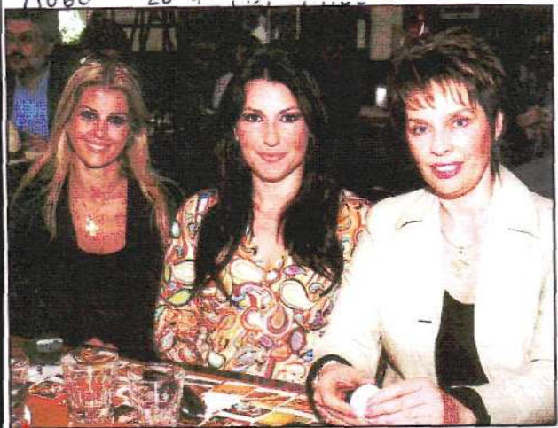
▲ Η βουλευτής Έλενα Ράπη, η Ειρήνη Νικολοπούλου και η βουλευτής Κατερίνα Παπακώστα